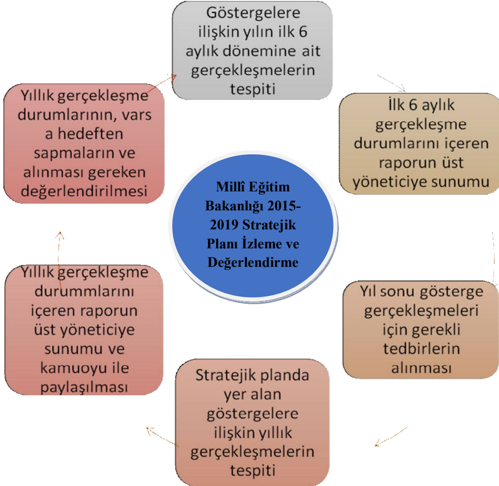
Şekil 3: Elka Ortaokulu Müdürlüğü 2015-2019 Stratejik Planı İzleme ve Değerlendirme Modeli

Raporlama Zamanı: İzleyen yılın Şubat ayı sonuna kadar.