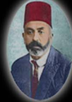
Mehmet Akif ERSOY

Dalgalar sen de şafaklar gibi ey şanlı hilâl! Olsun artık dökülen kanlarımın hepsi helâl. Ebediyen sana yok, ırkıma yok izmihlâl! Hakkıdır, hür yaşamış, bayrağımın hürriyet; Hakkıdır, Hakk'a tapan, milletimin istiklâl!